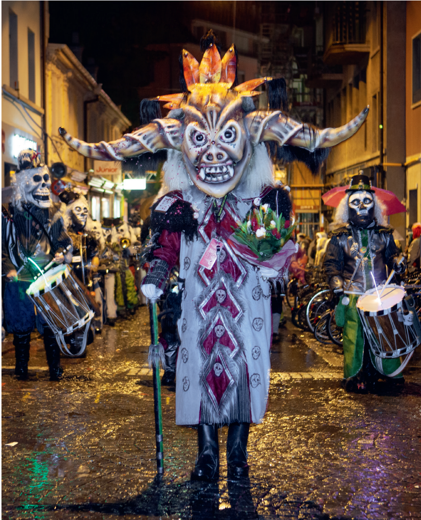
Monstercorso am Gütisdienstag.

koppelt sein. Die durch die «Vereinigten» gemeldeten Wagen werden am Gütisdienstag um 18.30 Uhr von der Feuerwehr beim Luzerner Theater kontrolliert. Siehe auch Hinweise auf www.vereinigte.ch .