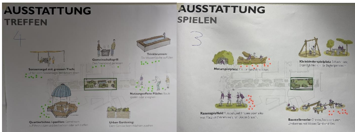
Abbildung 3: Ausstattung Treffen und Spielen mit Präferenzen der Teilnehmenden (vgl. Anhang)

Um die Ausstattungen in den Bereichen Treffen und Spielen zu priorisieren, durften die Teilnehmenden mit vier bzw. drei Punkten abstimmen, welche Ausstattungen sie für die Rösslimatte als besonders notwendig und wünschenswert erachten. Im Bereich Treffen sind die Quartierbühne/-pavillon und die nutzungsoffenen Flächen am beliebtesten. Ebenfalls wünschen sich die Teilnehmenden ein Sonnensegel mit grossem Tisch sowie einen Trinkbrunnen. Im Spielbereich haben die Massnahmen Rasenspielfeld, Baustellenecke und Naturspielplatz alle etwa gleich viele Stimmen erhalten. Die Ausstattungen Urban Gardening und Kleinkinderspielplatz erhielten keine Punkte, da sie aus der Sicht der Teilnehmenden bereits genügend im Quartier vorhanden sind.