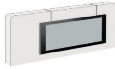
beidseitige Bildhängung mit Fäden