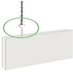
Hakenschraube, Ring und Kette