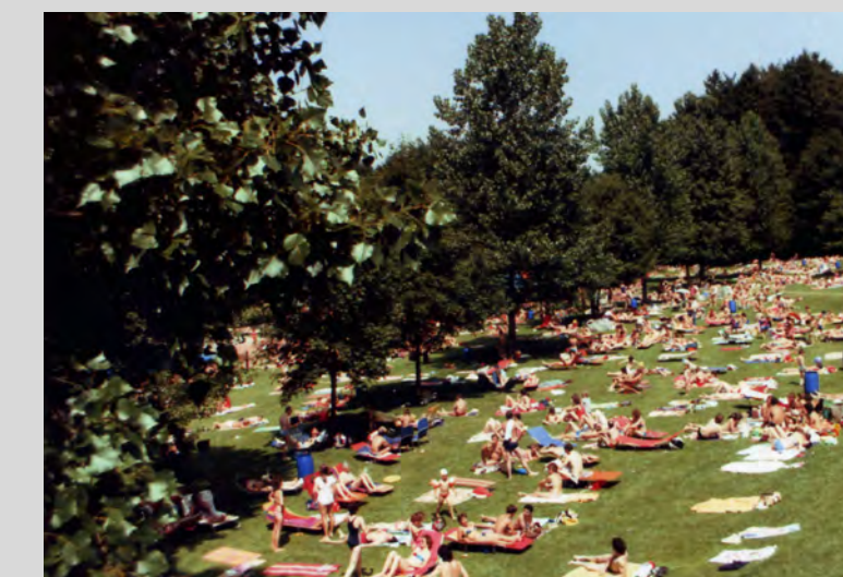
Das Bad bietet genügend Platz für viele Gäste.