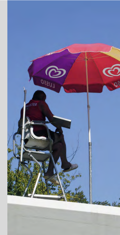
Badmeister auf «Wachposten».