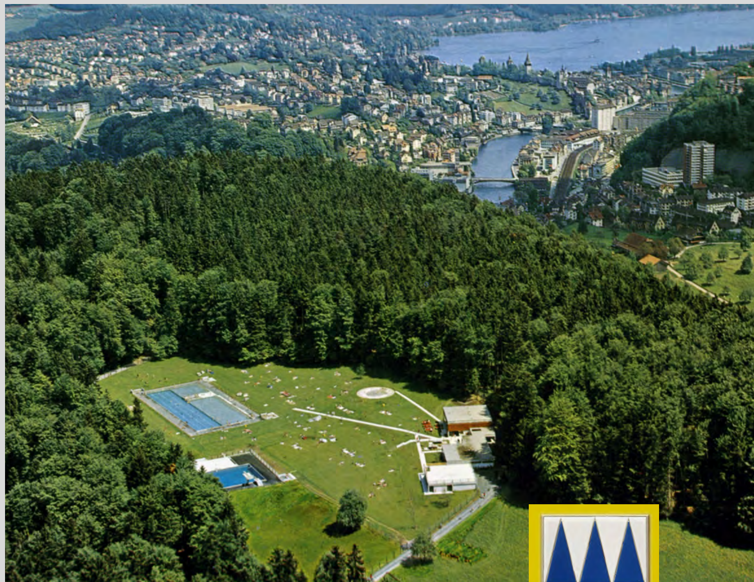
Am 30. Juli 1967 konnte das neue Bad eröffnet werden. Die Luftaufnahme zeigt die idyllische Lage des Waldschwimmbades Zimmeregg.