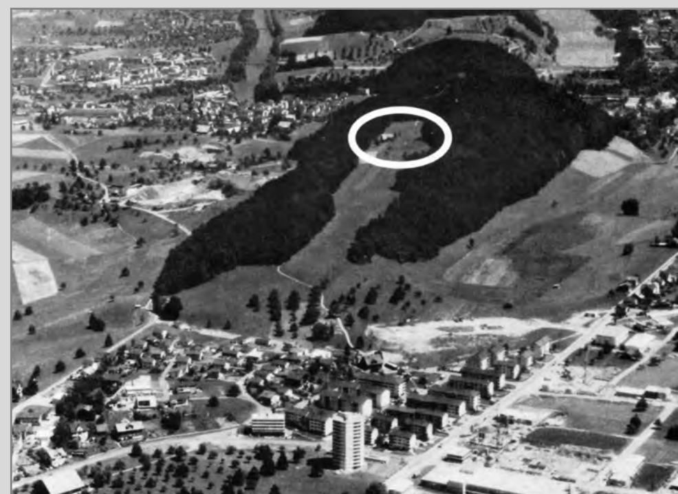
Das Waldschwimmbad befindet sich etwas erhöht über Littau und Reussbühl in einer Waldlichtung.