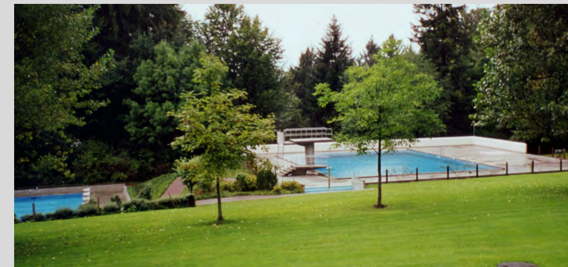
Die vielseitige Anlage präsentiert sich stets in gepflegtem Zustand.