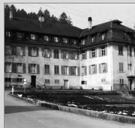
1846 fand im Rothenbad eine geheime Vorkonferenz zum Sonderbund statt.