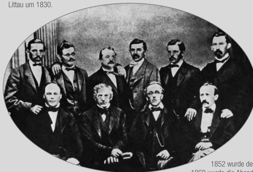
1852 wurde der Abendzirkel Littau gegründet (Bild 1866). 1869 wurde die Abendgesellschaft Reussbühl gegründet.