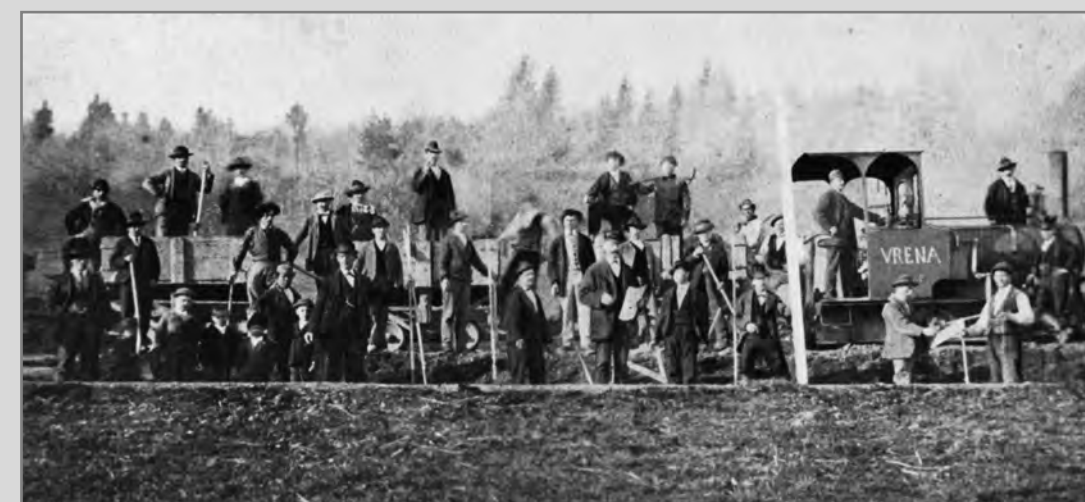
Arbeiter beim Bau der Bahnlinie Luzern–Bern um 1874.