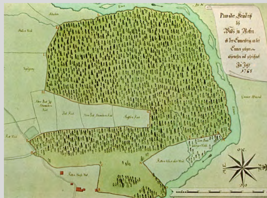
Der Rother Wald als Staatswald mit Umgebung, 1768.

1860 Im Sonnenberg wird erstmals Kohle abgebaut.