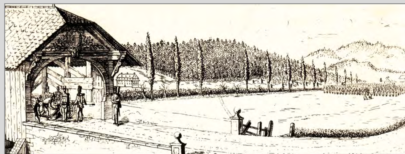
1844 kämpften die Freischaren an der Emmenbrücke.