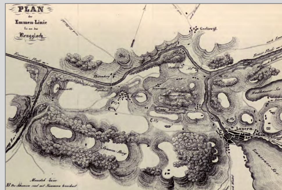
Dieser Plan zeigt die Feldbefestigungen der Sonderbundsarmee im Raume Littau.