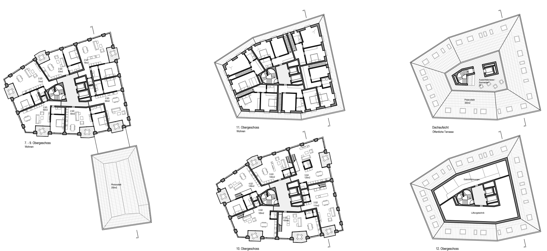
Grundrisse, Schnitt 1:200