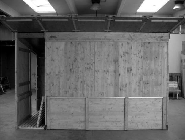
Geschlossener Stand mit Eingang