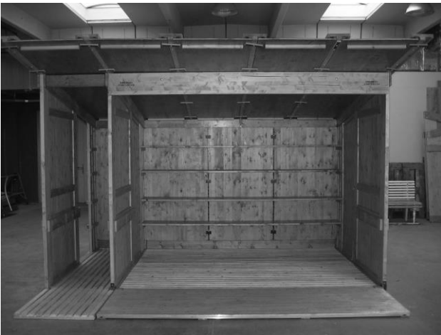
Offener Stand mit Tablare