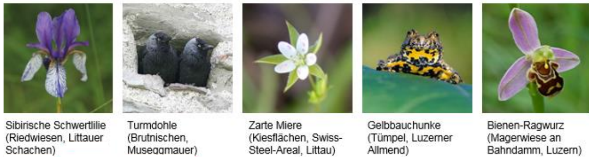
Abb. 4: Die Vorkommen gefährdeter bzw. National Prioritärer Arten in der Stadt Luzern verteilen sich über ein breites Spektrum verschiedener Artengruppen bzw. Lebensraumtypen

Hochwertige, über das ganze Stadtgebiet verteilte, ökologisch gut vernetzte Lebensräume sind eine Grundvoraussetzung dafür, gefährdete und geschützte Arten zu erhalten. Darüber hinaus sind für einen Teil der gefährdeten Arten, darunter auch viele siedlungstypische, weitergehende artspezifische Fördermassnahmen notwendig. Wichtige Voraussetzungen für solche Förderprogramme sind eine gute Datengrundlage sowie ein regelmässiges Monitoring. Die städtischen Aktivitäten berücksichtigen laufende bzw. neue Aktionspläne und Artenförderprogramme auf Bundes- und Kantonebene.