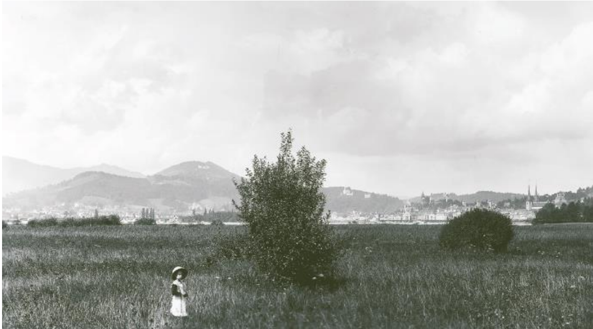
Abb. 1: In der Stadt Luzern hat sich der Flächenbestand der Riedgebiete seit Anfang des 19. Jahrhunderts von etwa 110 Hektaren auf nur noch 1,5 Hektaren reduziert (Bezugsraum: altes Stadtgebiet). Das Bild zeigt das Brüelmoos im Bereich des Würzenbachdeltas um 1915.

Bemerkenswert ist hierbei, dass die städtische Natur für etliche Arten, die ihren natürlichen Lebensraum verloren haben, zu einem Refugium geworden ist. Das gilt beispielsweise für gewisse Vogel- und Fledermausarten, die ursprünglich an Felsen oder in naturnahen Wäldern mit vielen Höhlenbäumen vorkamen. Sie finden heute beispielsweise an historischen Gebäuden Unterschlupf. In der Stadt Luzern sind hier etwa der Wasserturm oder die Museggmauer zu nennen. Sie bieten Turmdohlen, Alpen- und Mauerseglern und verschiedenen Fledermausarten Lebensraum. Im Weiteren konnten Pionierarten, die ihren ursprünglichen Lebensraum in naturnahen Auenlandschaften hatten, ihren Ersatzlebensraum auf dynamischen Ruderalflächen finden.