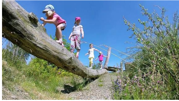
Abb. 2: Biodiversitätsförderung im städtischen Raum bedeutet vielfach auch die Förderung von Naturerlebnissen vor der eigenen Haustür. Dank der kurzen Distanzen kommt Stadtnatur einer grossen Zahl von Menschen zugute und ist in der Regel schnell und umweltfreundlich erreichbar.

Somit ist die Stadt Luzern mit der Herausforderung konfrontiert, die Stadtnatur trotz der weiter fortschreitenden, im Hinblick auf die Schonung der Landschaft wichtigen und sinnvollen Verdichtung in ihren vielfältigen Ausprägungen und Funktionen zu erhalten und zu fördern. Dazu sind auf städtischer Ebene sowohl auf der strategisch-konzeptionellen Ebene als auch im Hinblick auf die Planung und Umsetzung konkreter Förder- und Aufwertungsmassnahmen verstärkte Anstrengungen erforderlich. Von einem qualitativ hochwertigen Gerüst aus biodiversitätsfreundlich gestalteten, gut vernetzten und zugänglichen Frei- und Erholungsräumen profitieren nicht nur Flora und Fauna, sondern letztlich die gesamte Bevölkerung.