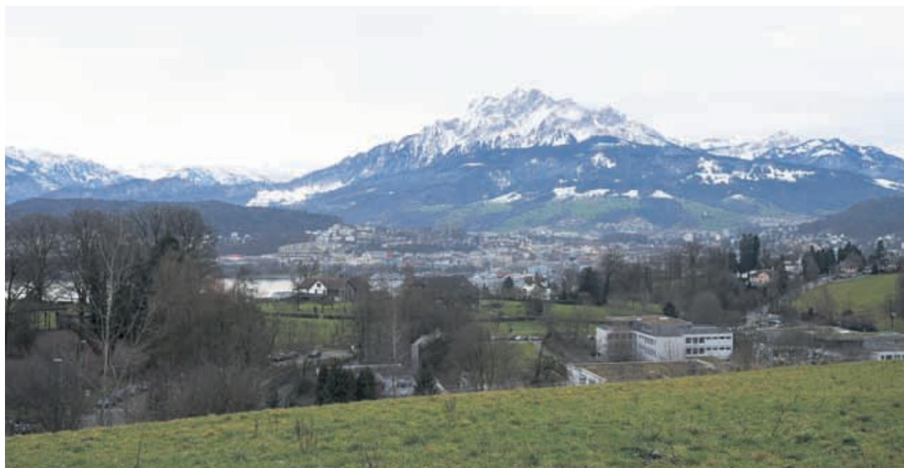
Blick vom Naherholungsgebiet auf den See, den Luzerner Hausberg und die Schulanlage Utenberg.

Der Utenberg steht zwar im Schatten des mondänen Dietschibergs – dennoch gehört er zu den beliebtesten Naherholungsgebieten der Stadt Luzern. Auf engstem Raum treffen die unterschiedlichsten Interessen aufeinander.