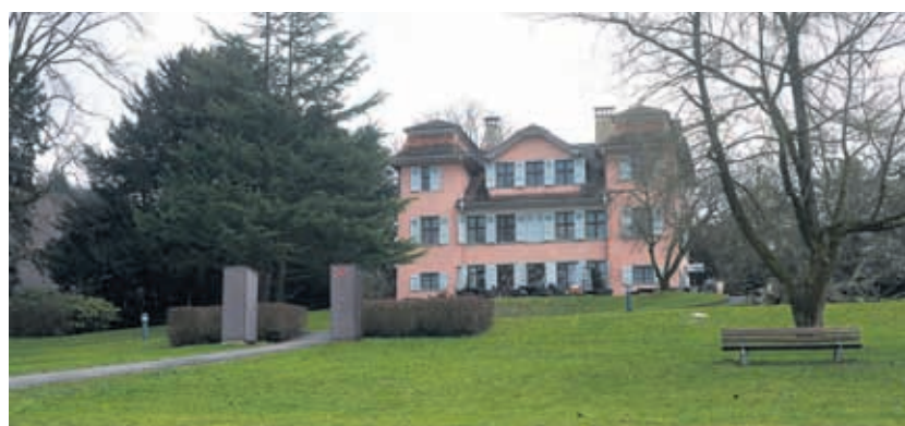
Schössli Utenberg: einst Privatwohnsitz, dann Trachtenmuseum, heute Restaurant.

Früher auf der Allmend zuhause, besitzen die Landhockeyanerinnen und -hockeyaner des LSC heute beim Utenberg sogar ein eigenes Clubhaus. 300 Spielerinnen und Spieler verteilen sich auf verschiedene Nationalligateams, diverse Jugend-, eine Elternmannschaft und ein Seniorenteam. «Die absolut ideale Infrastruktur auf dem Utenberg macht den Umstand wett, dass wir seit dem Umzug nur noch bedingt mit den übrigen Sektionen des