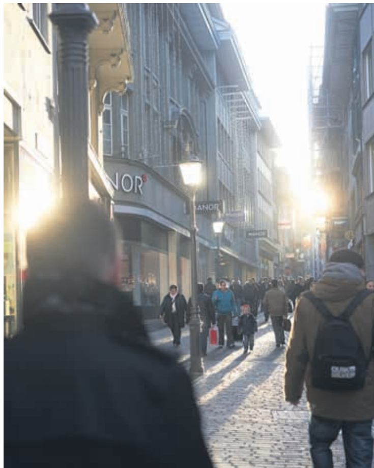
Gemeinsam mit privaten Unternehmen und im Dialog mit der Bevölkerung will der Stadtrat die Innenstadt zum prosperierenden Zentrum entwickeln.

Mit der Gesamtplanung steuert der Stadtrat seine Politik. Im Zentrum der Planung 2015 bis 2019 stehen dabei Verbesserungen beim Verkehr, beim gemeinnützigen Wohnungsbau, bei der Wirtschaft und beim Finanzhaushalt.