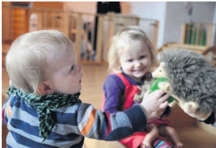
Die Erwerbsquote von Frauen hat dank der Betreuungsgutscheine in der Stadt Luzern überdurchschnittlich zugenommen.

www.betreuungsgutscheine.stadt Luzern.ch