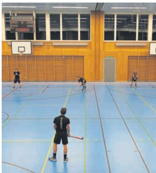
Landhockey boomt auf dem Utenberg: Der Luzerner Sportclub verzeichnet jährliche Zuwachsraten von 10 Prozent.