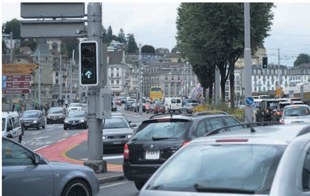
Schwerpunkt Verkehr: Das Parlament wird Ende Jahr über das Gesamtverkehrskonzept diskutieren können.

Für die sechs Fraktionen des Grossen Stadtrates ist es klar: 2015 stehen drei Themen im Zentrum der Debatten: die Verbesserung der Verkehrssituation, die Stabilisierung der Finanzen und der Standort des neuen Theaters.