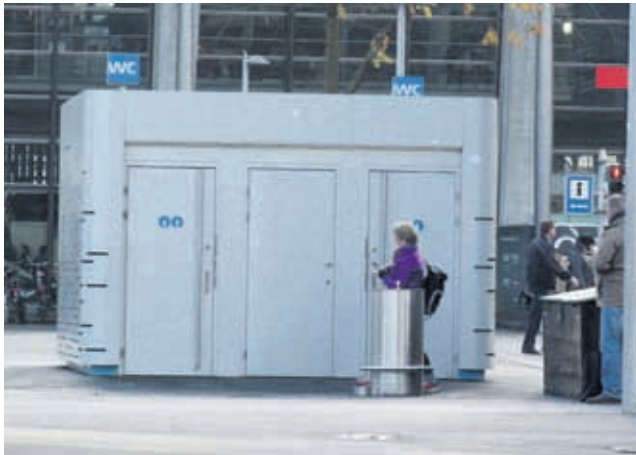
Die neue WC-Anlage auf dem Bahnhofplatz wurde im Herbst 2012 in Betrieb genommen.

Der Stadtrat hat den Masterplan öffentliche WC-Anlagen von 2009 überarbeitet. Er beantragt für die Umsetzung beim Parlament einen Zusatzkredit von 1,91 Mio. Franken und für 2015 eine Erhöhung der Betriebskosten um 40'000 Franken.