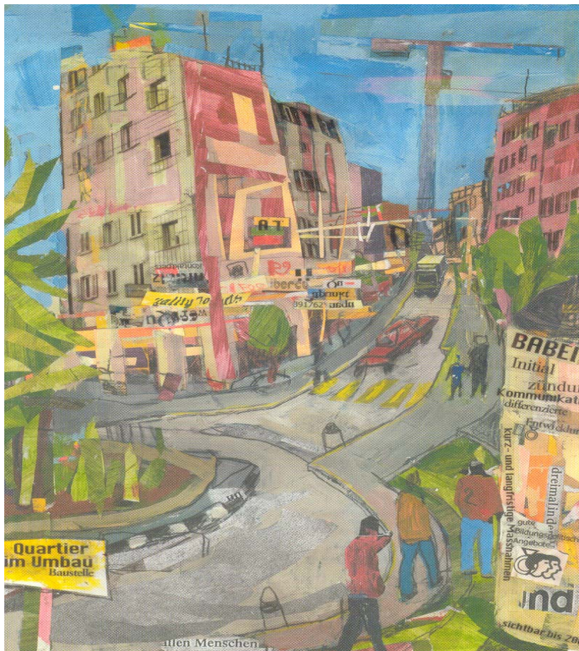
Illustration: Luca Schenardi, Luzern