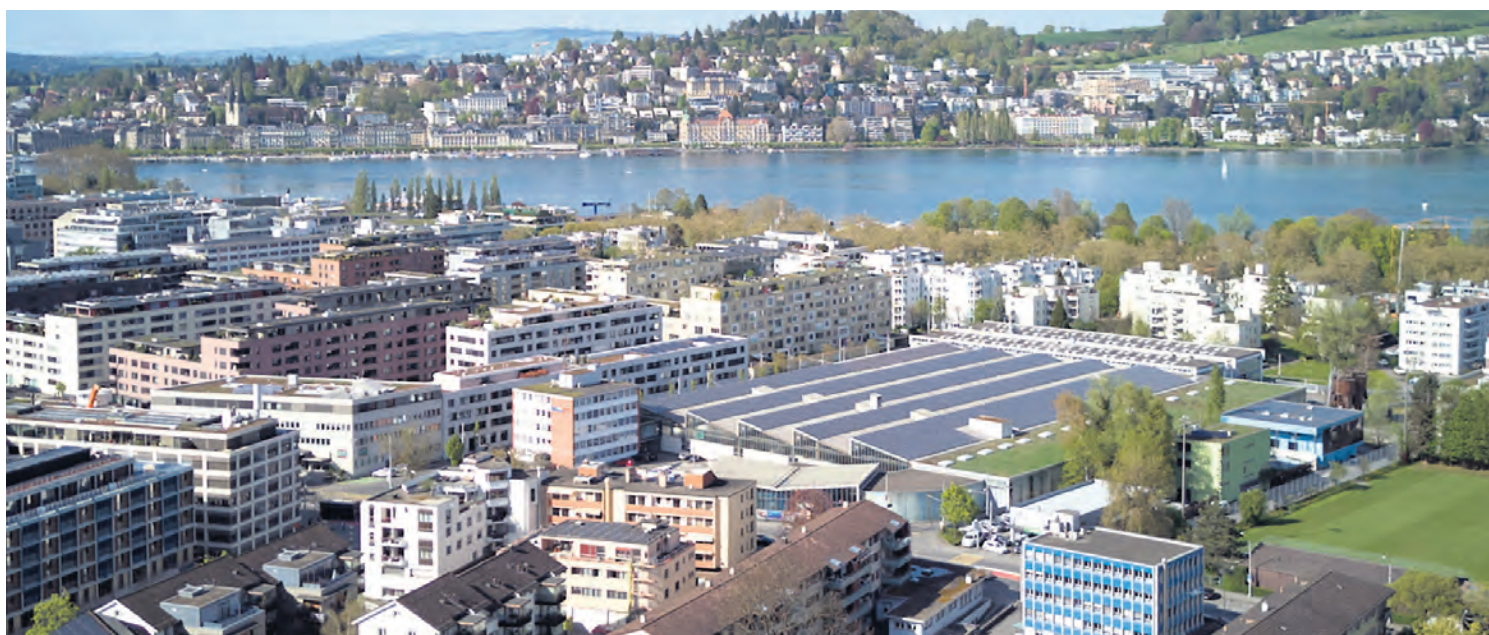
Das linke Seeufer wurde immer dichter und lebendiger. Heute dominieren die grossen Wohnüberbauungen. Der industrielle und gewerbliche Charakter ist geblieben.