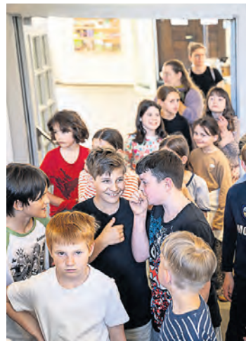
Die Spannung steigt: Wie geht man mit den Exponaten in der Ausstellung um?