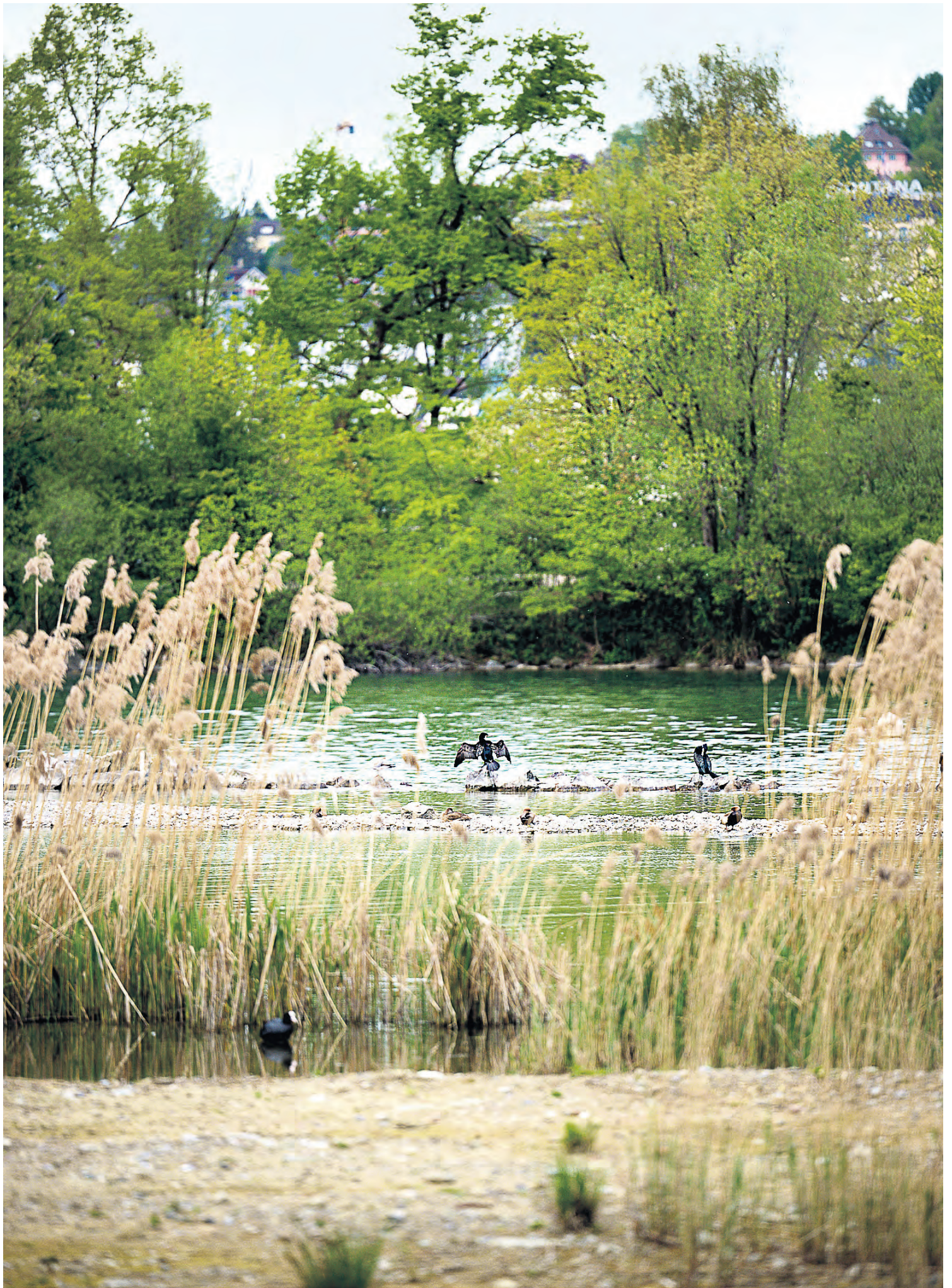
Nach den Sanierungsarbeiten kann sich das Schilf um die Brutinseln am Alpenquai wieder ausbreiten. Darüber freuen sich Wasservögel wie Hauben- und Zwergtaucher, Blässhuhn, Kolbenente, Kormoran oder Teichrohrsänger.