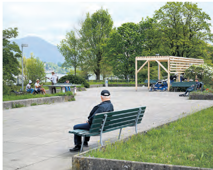
Auch das Apothekergärtli soll mit mehr Schatten, besseren Zugängen, einem mobilen Gastronomieangebot und einem Kinderspielplatz aufgewertet werden.