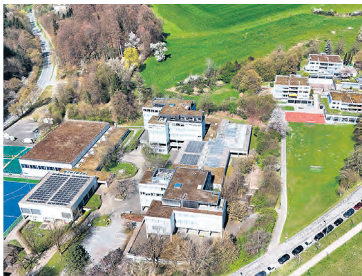
Luftaufnahme der Schule Utenberg sowie der Kinder- und Jugendsiedlung Utenberg (KJU).

Noch wird in der Schule und der Kinder- und Jugendsiedlung Utenberg mit Öl und Gas geheizt – neu soll Erdwärme diese Aufgabe übernehmen. Dafür und für den schneller als geplant voranschreitenden Ersatz weiterer Heizungen wird ein Kredit beantragt.