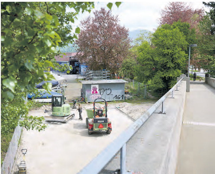
Ein Teil des Platzes beim Werftsteg wird zurzeit zu einem Pickleball-Feld umgestaltet. Langfristig entsteht hier ein attraktiver Begegnungsort.

Die Tribschenstrasse ist eine der wichtigsten Verbindungsachsen der Stadt Luzern. Sie ist mit ihren zahlreichen Gewerbenutzungen, Läden und Einrichtungen aber auch ein lebendiger Wohn- und Arbeitsort. Es fehlt jedoch an attraktiven Aufenthaltsräumen und einer komfortablen sowie sicheren Infrastruktur für den Fuss- und den Veloverkehr. Unter der Beteiligung der Quartierbevölkerung hat die Stadt Luzern ein Betriebs- und Gestaltungskonzept erarbeitet. Zurzeit wird ein Vorprojekt zur künftigen Verkehrsführung, zur Oberflächengestaltung und zur Sanierung der Werkleitungen erarbeitet. Gebaut wird frühestens ab 2029.