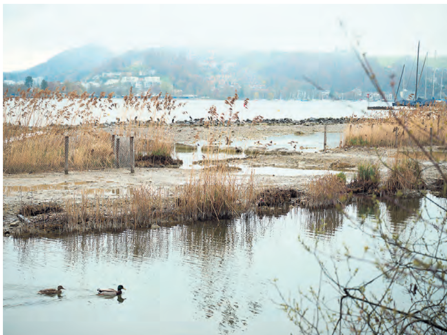
Die Brutinseln wurden von Dezember 2024 bis Frühling 2025 für rund 300'000 Franken saniert und aufgewertet.

Zu einem lebendigen Quartier gehören auch Tiere und Pflanzen. Die neu gestalteten Brutinseln bei der Kantonsschule Alpenquai bieten Wasservögeln dank Schilfgürteln, Kiesflächen und Flachwasserzonen Nist- und Rückzugsflächen.