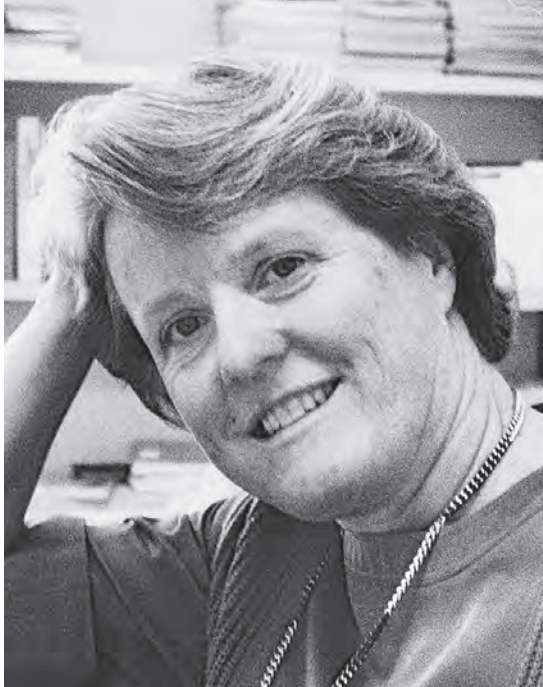
Judith Stamm (1934–2022): Vorbild und Wegbereiterin vieler Frauen. Sie war von 1983 bis 1999 Luzerner Nationalrätin.