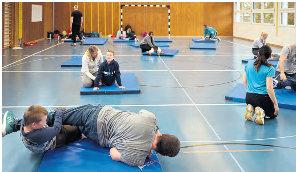
Im Workshop der Schulunterstützung erfahren Kinder und Eltern, dass faires Kämpfen Spass machen kann.

Mit Respekt gegeneinander kämpfen. Das Angebot für Familien der Schulunterstützung der Stadt Luzern stösst auf grossen Anklang und zeigt, dass faires Kämpfen gelernt sein will.