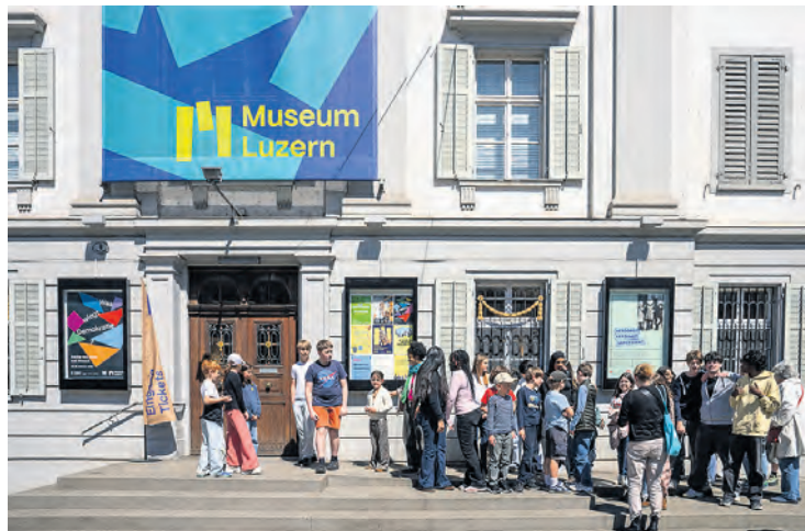
Mit Vorfreude im Gepäck: Die beiden Klassen erreichen das Museum Luzern.

Ein Austausch zwischen Altersstufen – das ist die Idee des Projekts «Zusammen ins Museum» der Schule Mariahilf. Ob Steinadler oder Fuchs: Die Lernenden erschaffen zu zweit eine Geschichte und eine Zeichnung, inspiriert von Exponaten des Museums.