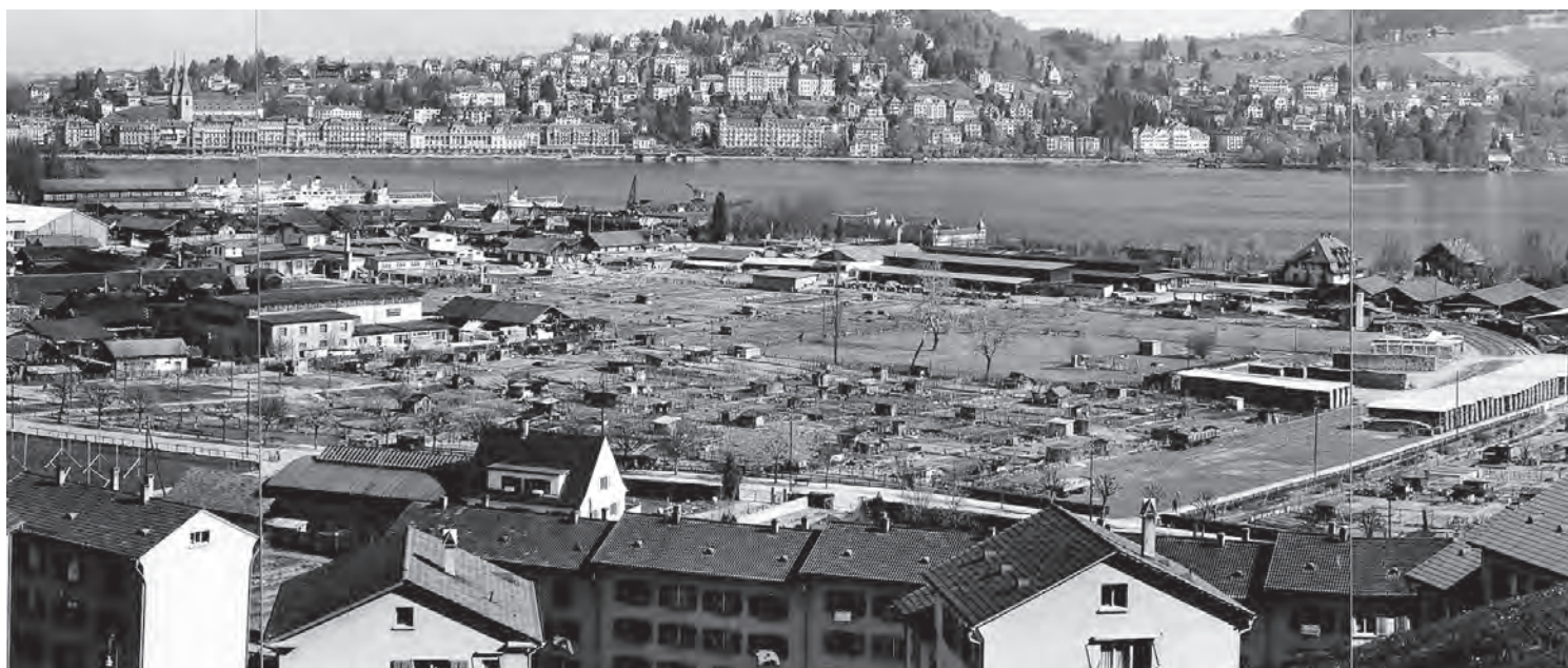
Ursprünglich prägten Weidland und Sumpf das Gebiet am linken Seeufer. Nach 1900 entstanden Industriebauten und Lagerplätze, und es hatte genügend Platz für Bildungs-, Freizeit-, Sozial-, Kultur- und Sporteinrichtungen. Die Fotografie von Otto Pfeifer zeigt das Gebiet im Jahr 1942.