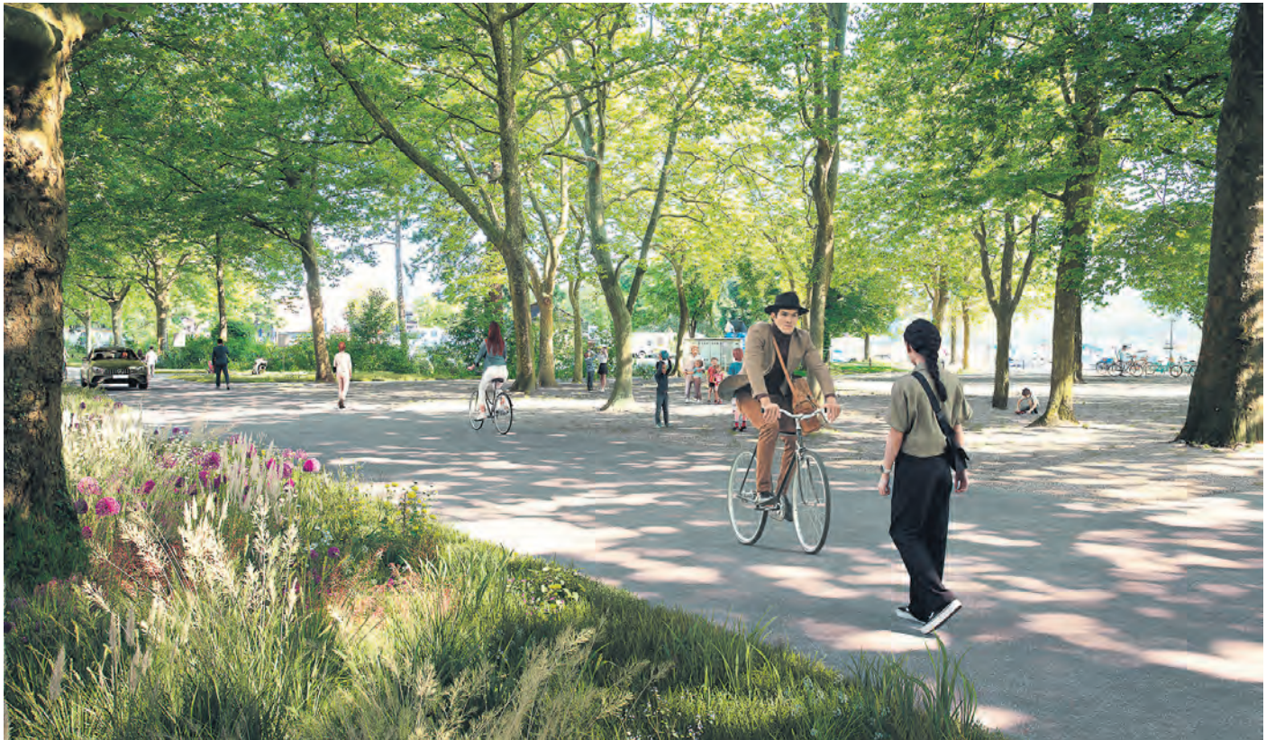
Der Alpenquai beim Kiesplatz bei der Ufeschötti. Die Visualisierung zeigt, wie sich dieser Raum ab 2030 präsentieren wird: eine sichere Fuss- und Veloverbindung, weniger Parkplätze und mehr Raum für die Bäume.

Das linke Seeufer ist ein vielseitig genutzter Stadtraum. Mit den Massnahmen und Projekten des Entwicklungskonzepts sorgt die Stadt Luzern dafür, dass das Gebiet als lebenswerter Ort erhalten bleibt und noch attraktiver wird.