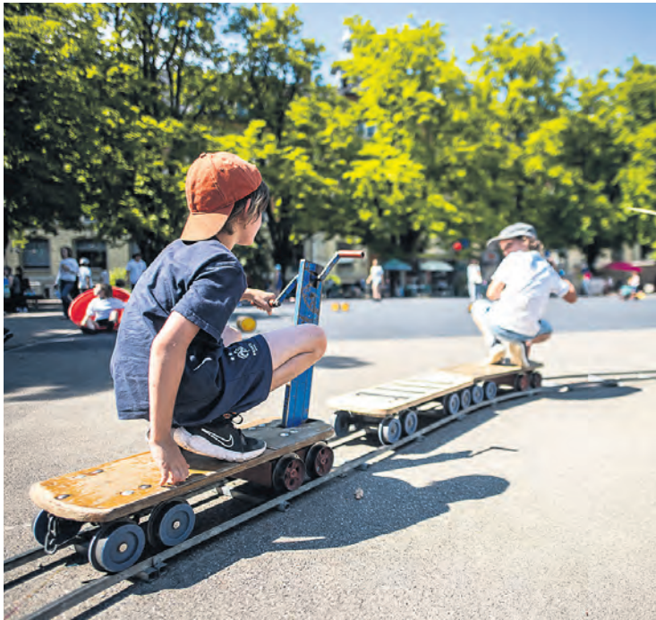
Die vielfältige Spiellandschaft im Ferienpasszentrum auf dem Pausenplatz Säli bietet Spiel und Spass für alle, die ihre Sommerferien in Luzern verbringen.

Seit 50 Jahren gehört der Luzerner Ferienpass zum Sommer wie ein Sprung in den Vierwaldstättersee oder eine kühle Glacé. Alle sind eingeladen, das Jubiläum zu feiern.