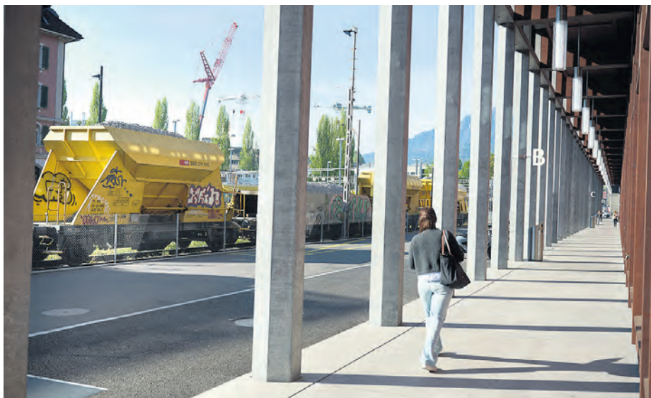
Studieren in einem spannenden Umfeld: der im Februar 2026 eröffnete Neubau «Perron» der HSLU, der Hochschule Luzern.

Am linken Seeufer bleibt fast kein Stein auf dem anderen: neue Wohnungen, neue Arbeits- und Studienplätze, neue Frei- und Naturräume. Das Resultat ist ein dichter, bunt durchmischter Lebensraum – der allerdings immer wieder durch Interessenkonflikte auf die Probe gestellt wird.