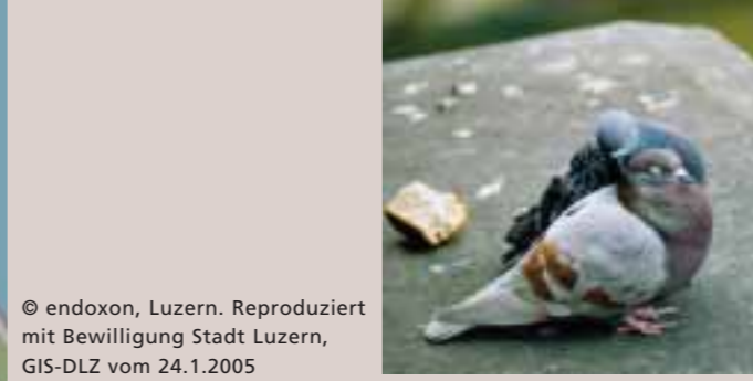
Reproduziert mit Bewilligung Stadt Luzern, GIS-DLZ vom 24.1.2005