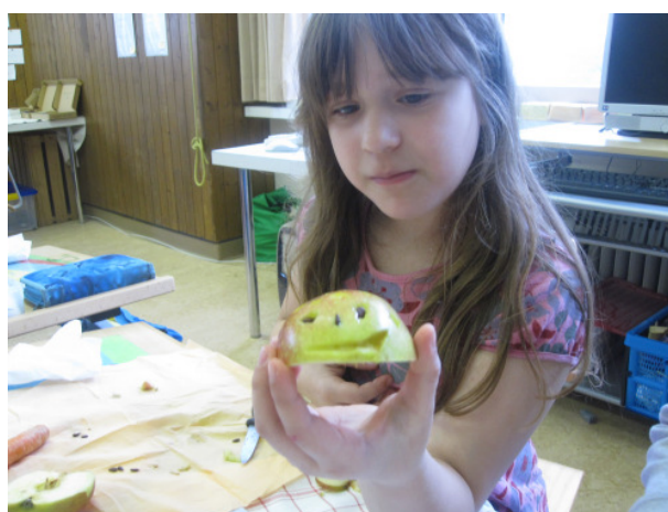
Atelier Kochrezepte aus aller Welt

Mit oder ohne Quartierspuren – in jedem Atelier fand man stets zufriedene Gesichter.