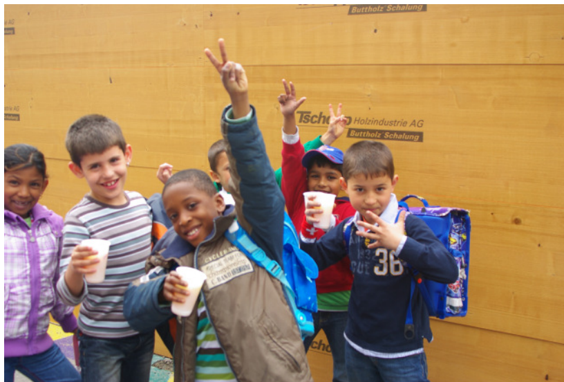
Auf die Projektwoche!

Zum Schluss der quer durchs Quartier verteilten Aktion traf man sich kurz vor dem Mittag wieder auf dem Schulhausplatz ein und stiess mit einer Bowle, von welcher die Zutaten als Schätze gesucht und gebracht werden mussten, gemeinsam auf die kommende Woche an.