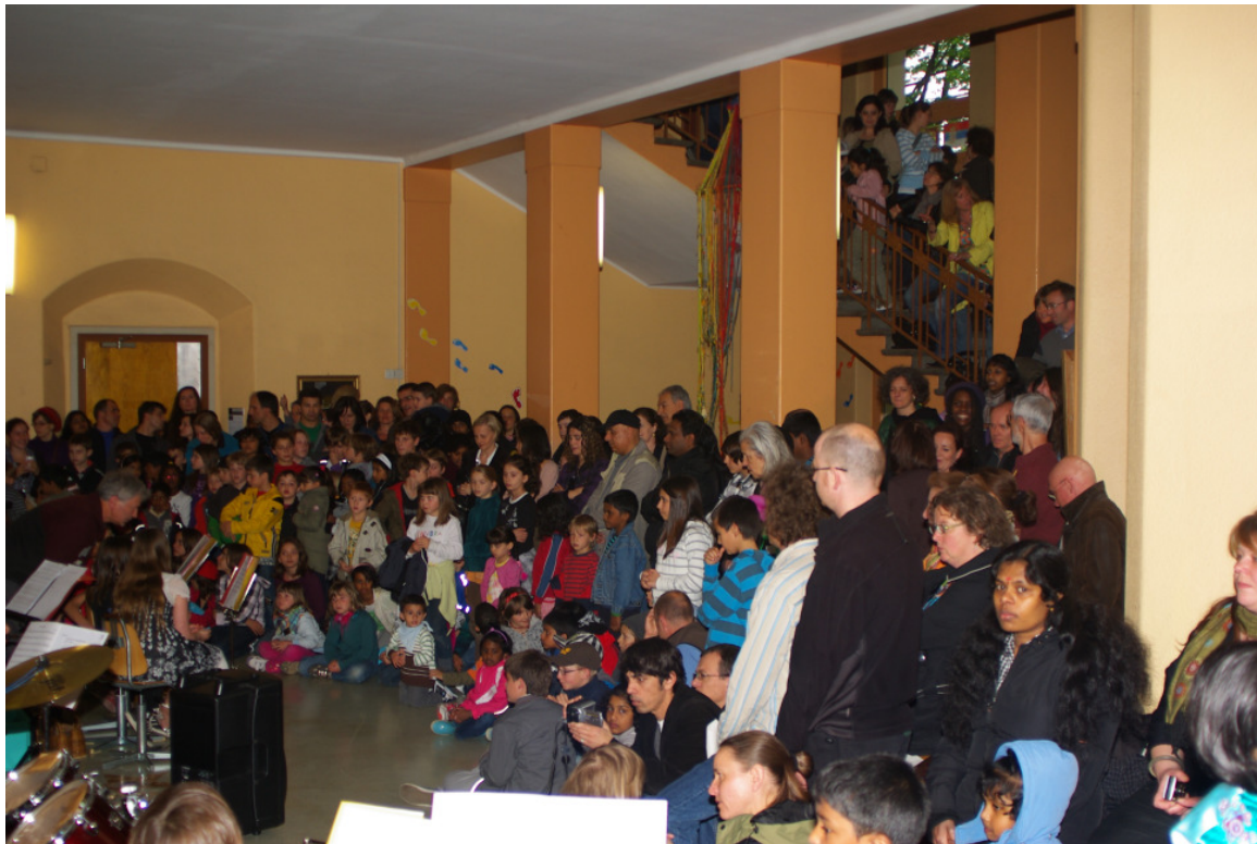
Auftritt der Band im 2. Stock

Schwärme von Kindern mit ihren Eltern eroberten den Schulhausboden. Viele versammelten sich auf dem zweiten Stock, wo sich die Band des Musikateliers gerade aufstellte. Gespannte Gesichter schauten umher oder lasen das Programm. In jedem Stock warteten Zimmer mit Werken und Eindrücken der erlebten Woche, um betrachtet zu werden. Farbige Festdekorationen für die 100-Jahr-Feier im nächsten Jahr, ein Quartiermodell, Zeichnungen und Bastelwerke waren aufgestellt. Websites wurden projiziert und erklärt, selber gemachte Filme gezeigt, Spiele präsentiert. Es gab so viel zu sehen! In jeder Ecke sah man das Quartier wieder aus einer weiteren Perspektive. Stolze Eltern und aufgeregte Kinder wanderten hinauf und hinunter. Zwischendurch stärkte man sich im untersten Stock beim Apéro, welcher traditionsgemäss von der offenen Elternrunde organisiert wurde. Auf dem 2. Stock wurden nach der Musikdarbietung HipHop, Volkstanz und Tango vorgeführt, welche mit Fachpersonen aus dem Quartier einstudiert wurden. Erschöpft aber zufrieden machte man sich schliesslich auf den Nachhauseweg. Welch eine Woche!