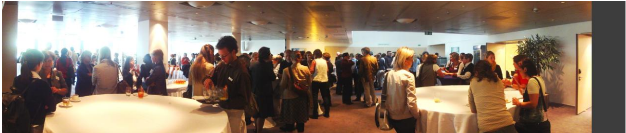
Abb. 2: Tagungsteilnehmende im Hotel Radisson