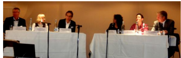
Abb. 3: Podiumsgespräch

Entwicklungspotenzial der Kinder und die Bedürfnisse der arbeitenden Eltern ausgerichtet. Das System in der Stadt Luzern wird so vergleichbar mit dem der Skandinavischen Ländern, Kanada und Neuseeland. Kritisch blieb sie trotz dieser positiven Entwicklung in Bezug auf die Kinder ohne familienergänzende Kinderbetreuung, die in dieser Entwicklung nicht auf der Strecke bleiben dürfen.