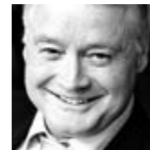
Urs W. Studer Stadtpräsident

Luzern soll Standort der Salle Modulable werden. Das sei eine grosse Chance, sagt Stadtpräsident Urs W. Studer. Die Stadt kommt so zu einem der innovativsten Räume für Musiktheater in der Schweiz.