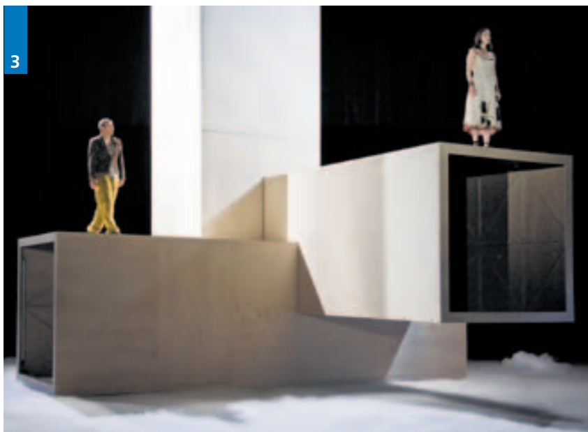
3 | Das Schauspiel-musical «Woyzeck» 2009/2010 am Luzerner Theater: ein Beispiel einer Koproduktion von Luzerner Theater und Lucerne Festival.

betrieb von Lucerne Festival, womit das neue Haus im Jahresverlauf ausgelastet ist.