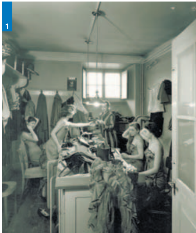
1 Garderobe des Stadttheater-Balletts, 1959.

1839 wurde das Stadttheater eingeweiht. Das Haus steht seither immer wieder im Fokus der Politik. Eine Ausstellung des Stadtarchivs und des Luzerner Theaters gibt Einblick in die lange Theatertradition.