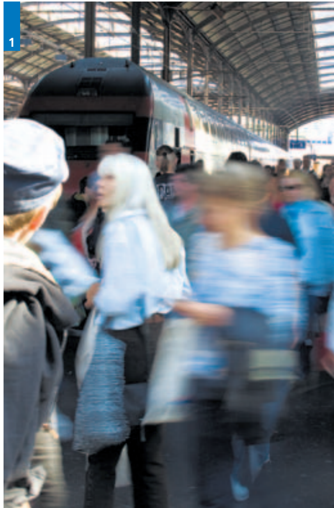
1 | Luzern–Zug–Zürich: Die Bahnstrecke weist heute schon die drittgrösste Passagierfrequenz der Schweiz auf. Die SBB prognostizieren für diese Linie bis ins Jahr 2030 landesweit die grösste Steigerungsrate. Dieses Verkehrsaufkommen kann nur mit dem Tiefbahnhof bewältigt werden.

Alle Fraktionen im Grossen Stadtrat sind sich einig: Luzern braucht den Tiefbahnhof. Ob die Volksinitiative der Grünen oder der Gegenvorschlag des Stadtrates zu diesem Ziel führen soll, darüber entscheiden die Stimmberechtigten am 7. März.